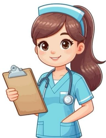
Obrázek 1 Popisek obrázku